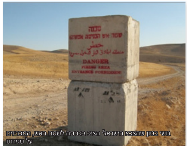
משי בסון שהצבא הישראלי הציב בכניסה לשטח האש, המכריזים על סגירתו

על פי נייר העמדה של משרד הביטחון, שטח האש יהיה מחוץ לתחום לקהילות העקורות, למעט עיבוד אדמה ורעיית עדרים בסופי שבוע או בחגים היהודיים, שבהם לא מתבצעים אימונים. כל שתיים עשרה הקהילות, לרבות שמונה הקהילות העקורות, יוכלו להשתמש בשטח האש רק לתקופות מוגבלות בנות חודש, פעמיים בשנה, לצורכי חקלאות ומרעה.