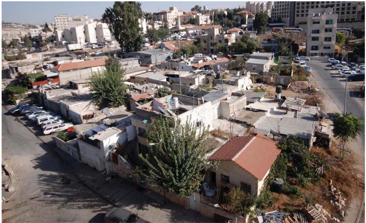
קובניית אום הארון, שייח' ג'ראח, ספטמבר 2010

הפלסטינים באזור, העניקה עיריית ירושלים לארגון היתר לכניית בית משרדים ומרכז כנסים בגובה שלוש קומות, שימש כמטה הארגון. 15