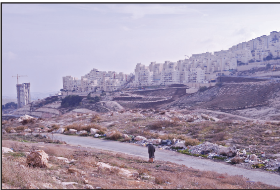
התנחלות הר חומה. צילום: גי צי טורדאי, 2009.

Cartography: OCHA-oPt - January 2012. Base data: OCHA, PA MoP. Settlement data: Peace Now, OCHA update 08. For comments contact <ochaopt@un.org> or Tel. +972 (02) 582-9962 http://www.ochaopt.org