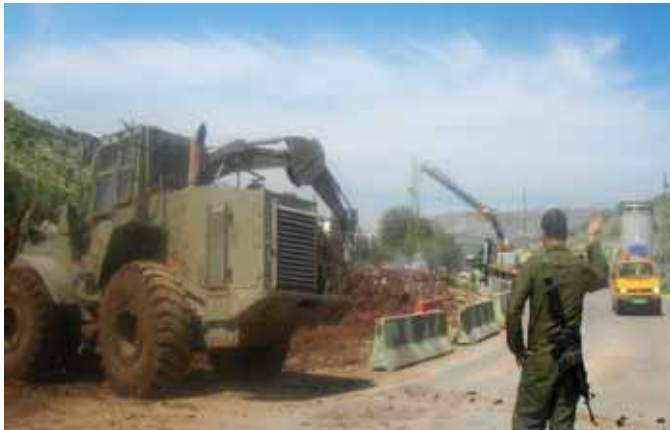
הרחבת מחסום עינב, טולכרם. צולם במרץ 2009.

ממוצע של 127 מטענים ליום. בעוד שמספר מטענים זה גבוה בהרבה בהשוואה למספרם לפני הלחימה (בנובמבר-30 מטענים; בדצמבר-23 מטענים) עדיין הוא נמוך יותר ממספרם במאי 2007 (475), חודש לפני השתלטות חמאס. כתוצאה מכך הייבוא אינו מספק עדיין את צורכי השוק. 80% מהמשאיות שנכנסו לרצועה בפברואר הכילו מצרכי מזון. לא הותרה הכנסתם של מוצרים חיוניים נוספים כמו חומרי בניין, חלקי חילוף לתשתיות מים וביו, תשומות לתעשייה ולחקלאות ובעלי חיים. בפברואר לא חל שיפור משמעותי בנגישותם של חולים לטיפולים רפואיים בחו"ל. מתוך 324 בקשות לאישורי יציאה שהוגשו במהלך החודש, אושרו תוך זמן סביר רק 183 (56.5%). במהלך החודש יצאה משאית אחת טעונה בכרחי קטיף - זו הפעם הראשונה מאז ינואר 2008 שהותר לייצא תוצרת מרצועת עזה.