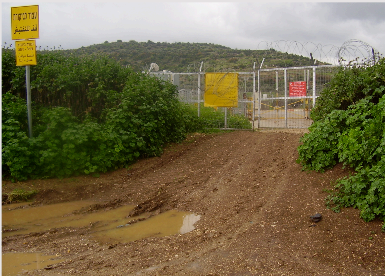
Sahel gate, for access to agricultural land in the Seam Zone. OCHA, 2007

http://www.ochaopt.org/documents/ICJ3_Special_Focus_July2007.pdf