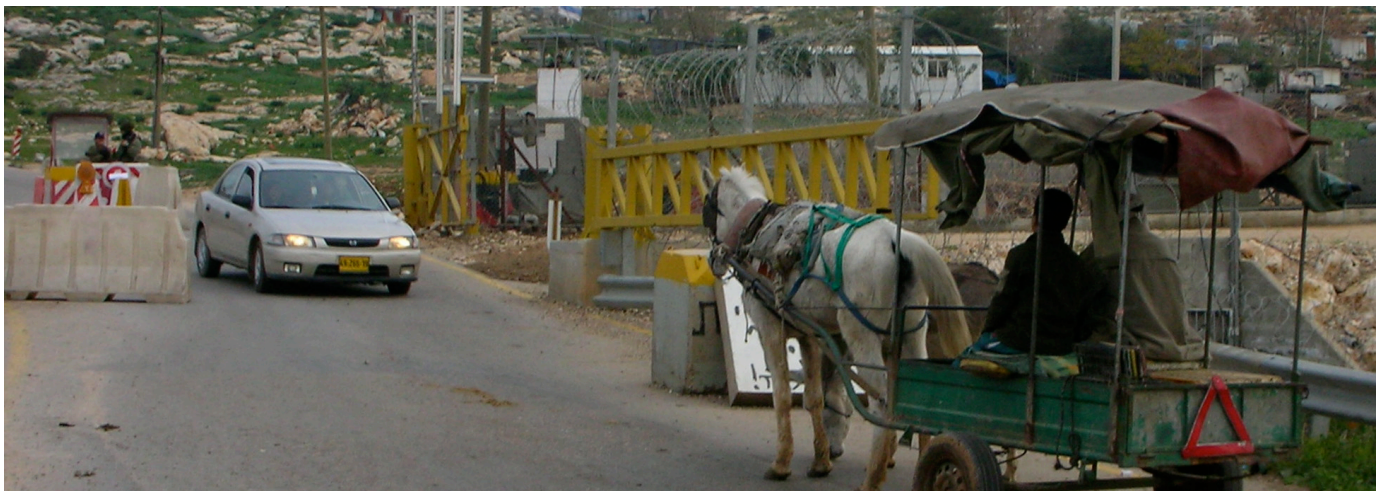
'Azzun 'Atma Gate: A farmer waits for a settler's car to cross before he faces the gate and has his permit checked.

בשנה ממוצעת נולדים בעזון עתמה כ-50 תינוקות. במובלעת זאת אין בית חולים או שירותי חירום רפואיים 24 שעות. ביממה. בישוב פועלת מרפאה ראשונית הנותנת שירותים בסיסיים ביותר במשך שעתיים, פעמיים בשבוע בלבד. על מנת להבטיח לעצמן טיפול רפואי נאות בעת הלידה, נשים הרות נוהגות לנטוש את בתיהן בתחילת החודש התשיעי להריון ולהעתיק את מגוריהן לבתי קרובים המתגוררים בגדה המערבית במקומות שם ניתן להבטיח קבלת שירות רפואי זמין וטוב. בין ינואר 2007 ותחילת יוני 2007 לתושבי עזון עתמה נולדו 33 תינוקות; 20 נולדו מחוץ לכפר ו-13 נולדו בכפר, בבית היולדת. באף אחת מהלידות שהתבצעו בבית בכפר לא נכחו מיילדת מוסמכת או רופא.