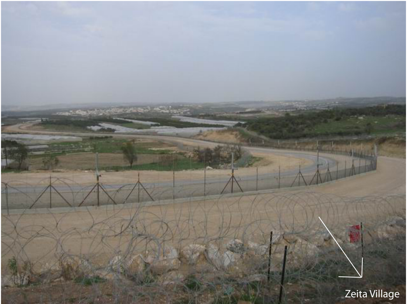
The Barrier where it separates Zeita Village from its greenhouses and agricultural land - OCHA, 2003