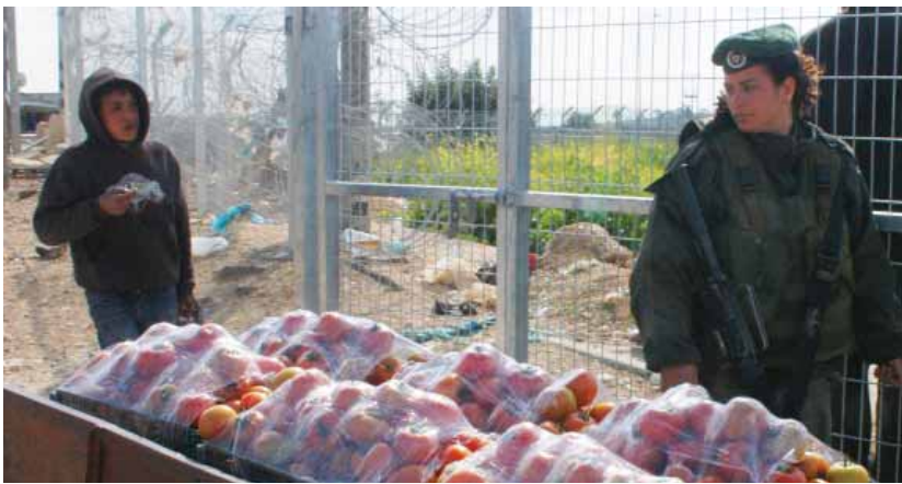
ילד פלסטיני מנסה לחצות את הגדר בשער החדש ליד עזון עתמה

הקשה בלאו הכי של חולים כרוניים רבים בעזה, ולעצירה מוחלטת של הטיפול בהפניות חדשות. מצב זה מעמיד בסכנה את חייהם של חולים כרוניים הזקוקים בדחיפות לטיפול רפואי מחוץ לרצועה.