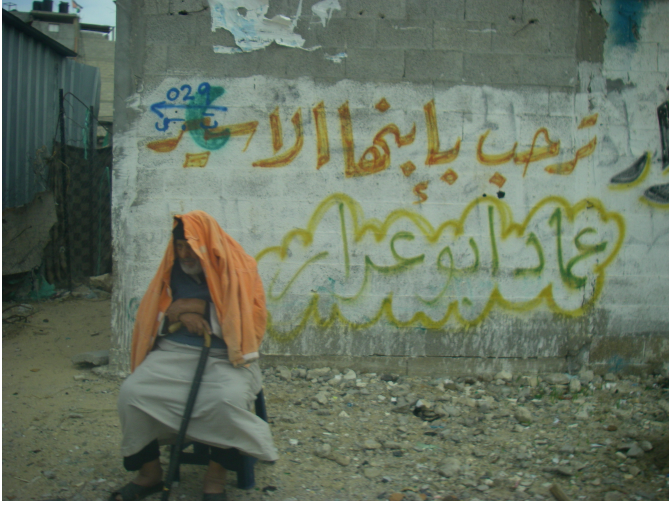
الانتظار: تم عزل قطاع غزة عن العالم الخارجي لفترة ستة أشهر

فرضت الحكومة الإسرائيلية قيود مشددة على حركة تنقل وعبور البضائع والناس منذ منتصف شهر حزيران 2007 بعد أن شهد القطاع فترة اقتتال فصائلي شديدة أدت في النهاية إلى سيطرة حركة حماس على قطاع غزة وانهيار ترتيبات التنسيق التي كانت متبعة على المعابر الرئيسية. وبتاريخ 28 تشرين أول من عام 2007، نفذت الحكومة الإسرائيلية عقوبات اقتصادية على قطاع غزة كرد على استمرار إطلاق صواريخ القسام وقذائف الهاون من قبل مسلحين فلسطينيين على إسرائيل. في الفترة ما بين 1 كانون ثاني و30 تشرين ثاني من عام 2007، أطلق ما مجموعه 1204 صواريخ قسام من شمالي غزة باتجاه إسرائيل مما أدى إلى وفاة إسرائيليين اثنين وإصابة 96 آخرين.